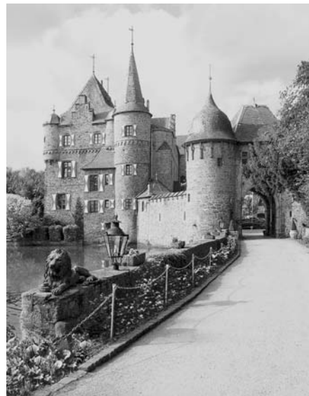
Das Burghaus von Burg Satzvey mit dem doppeltürmigen Torhaus von Nordosten.

Ritterfestspiele, historische Basare, Musik- und Theaterveranstaltungen ziehen im Laufe des Jahres viele Besucher an.