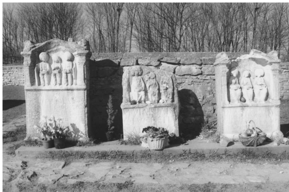
„Görresburg“, gallo-römischer Tempelbezirk.