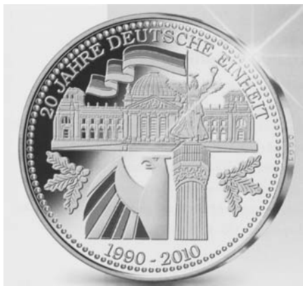
Gedenkprägung zum Staatsjubiläum der Bundesrepublik Deutschland: 20 Jahre deutsche Einheit

Aus dem Ruf „Wir sind das Volk“ wurde in Leipzig die Forderung „Wir sind ein Volk!“.