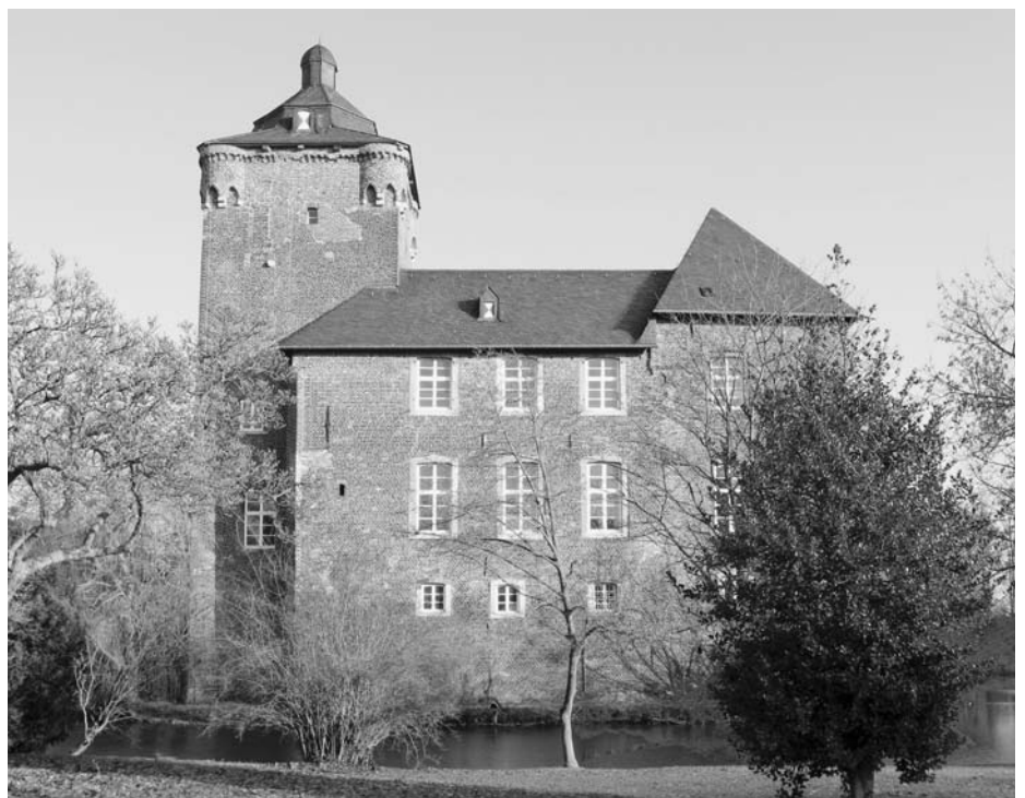
Schloss Trips: Das Herrenhaus von Südwesten

Heute befindet es sich im Besitz der Stadt Übach-Palenberg. Es wird auch als das „Schatzkästlein“ der Stadt bezeichnet.