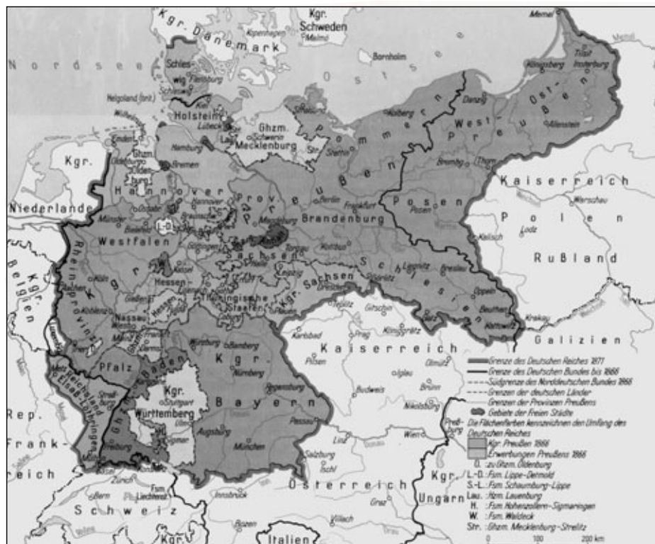
Das Deutsche Reich 1871

Auch der Kulturkampf, die Auseinandersetzungen zwischen dem preußischen Staat und der katholischen Kirche 1871 - 87, belastete das politische Leben im Deutschen Reich und trug zu einer Verschärfung der Gegensätze zwischen den gesellschaftlichen Gruppen bei.